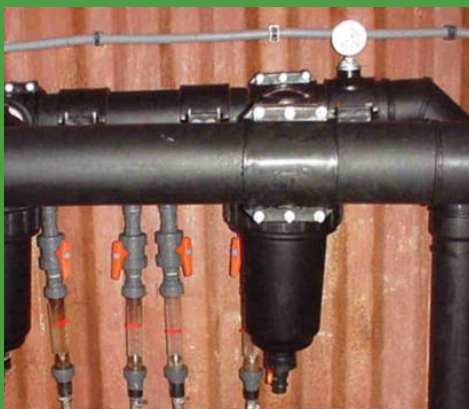
Se han destinado al suministro o reparto de aguas con fines agrícolas.

La cuantía de las subvenciones a conceder será del 40% de la inversión aprobada por el órgano instructor.