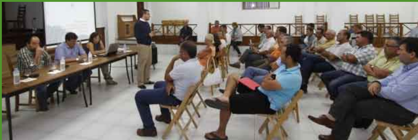
El Cabildo convocó reuniones con miembros del sector primario para que conocieran el Borrador y aportasen sugerencias.