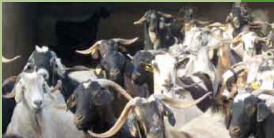
Uno de los "Usos" contemplados en el Borrador es el "Pastoreo".

El resumen de esta clasificación del suelo puede verse en el Plano de Síntesis de Ordenación.