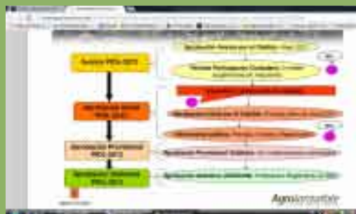
Procedimiento de aprobación del PIOL.

Todos los Usos están sometidos a una serie de Normas relativas a superficies mínimas de parcelas, superficies máximas de edificación, condiciones de integración paisajísticas, retranqueos, acceso a caminos, etcétera que han sido los aspectos más "criticados" en este último periodo de Sugerencias.