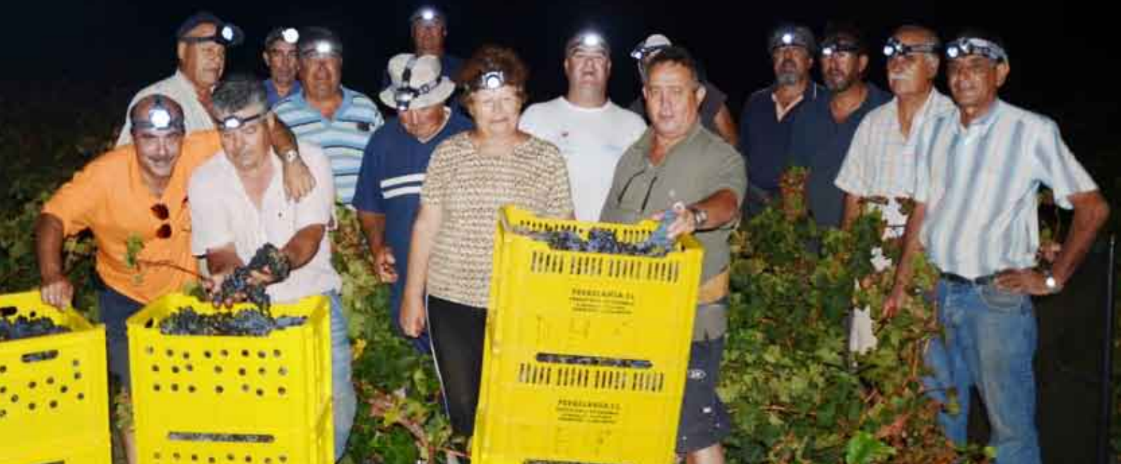
Bodegas La Grieta realizó una pionera vendimia nocturna.

Bodegas La Grieta realizó una novedosa recogida de uva nocturna