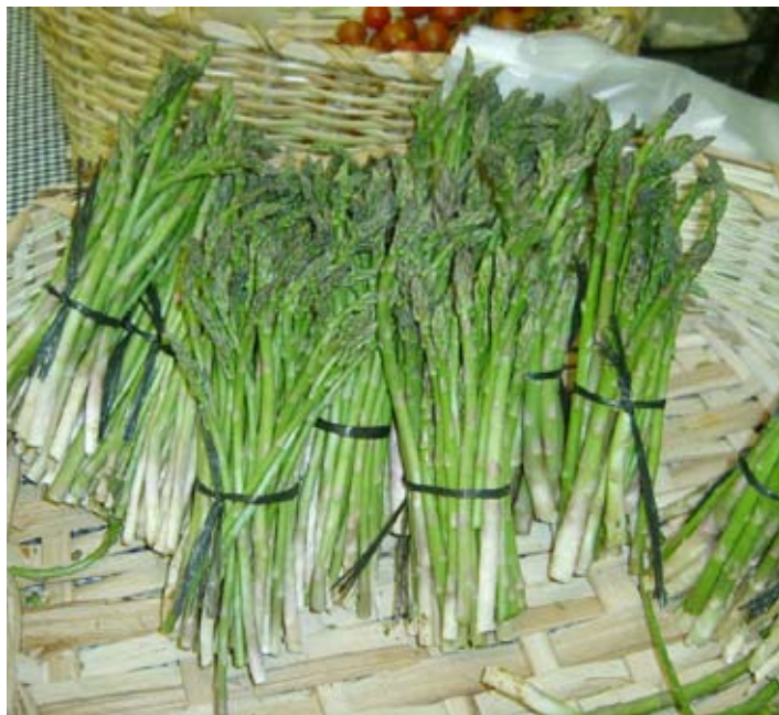
Es necesario pedir un mínimo de 1.000 plantas que se venden a 18 céntimos cada una.