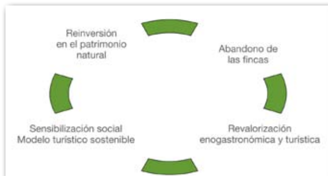
El Plan pretende establecer "un bucle sostenible" en La Geria.

En este apartado se seguirá apostando por pruebas ya consolidadas como la Wine Run (Carrera del Vino) y se fomentará tanto las rutas ciclistas como el senderismo a través de la puesta en valor del sendero Camel-Trail, entre otros.