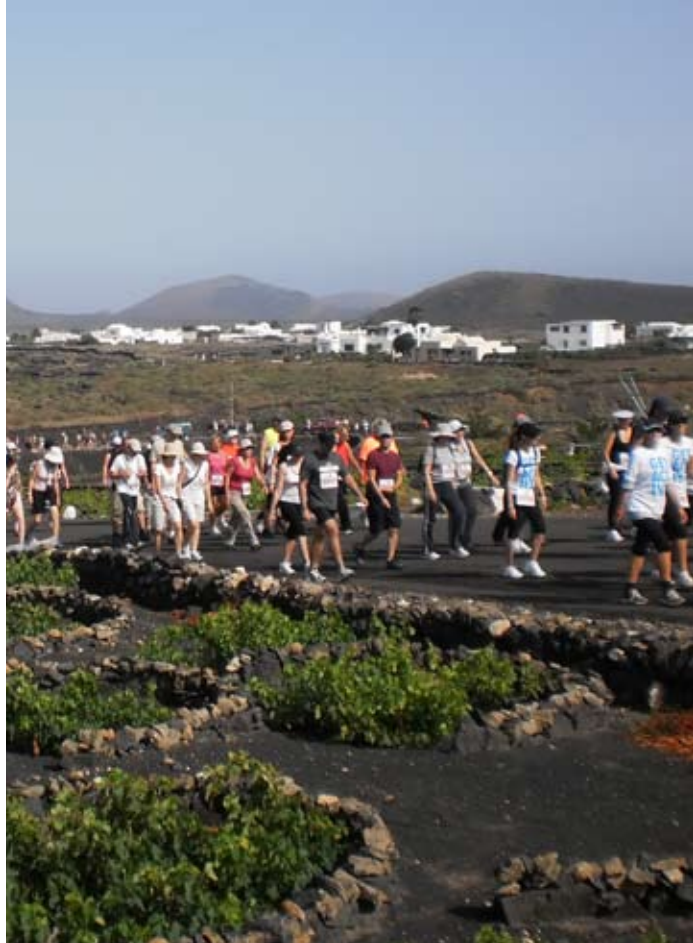
El Plan prevé la obtención de recursos a través de eventos como la Wine-Run.

El presidente del Cabildo felicitó a todos por el “trabajo conseguido hasta la fecha” y destacó el apoyo dado recientemente por el Parlamento canario al Consorcio de La Geria para que este espacio opte, como candidatura única de las Islas, al “Premio Europeo del Paisaje 2013, paso previo para alcanzar “el objetivo final que es que La Geria sea declarada Patrimonio de la Humanidad”, señaló Pedro San Ginés.