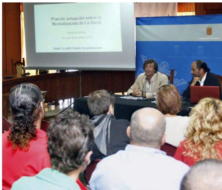
La presentación del Plan contó con la presencia de numerosos agentes implicados de la Isla.